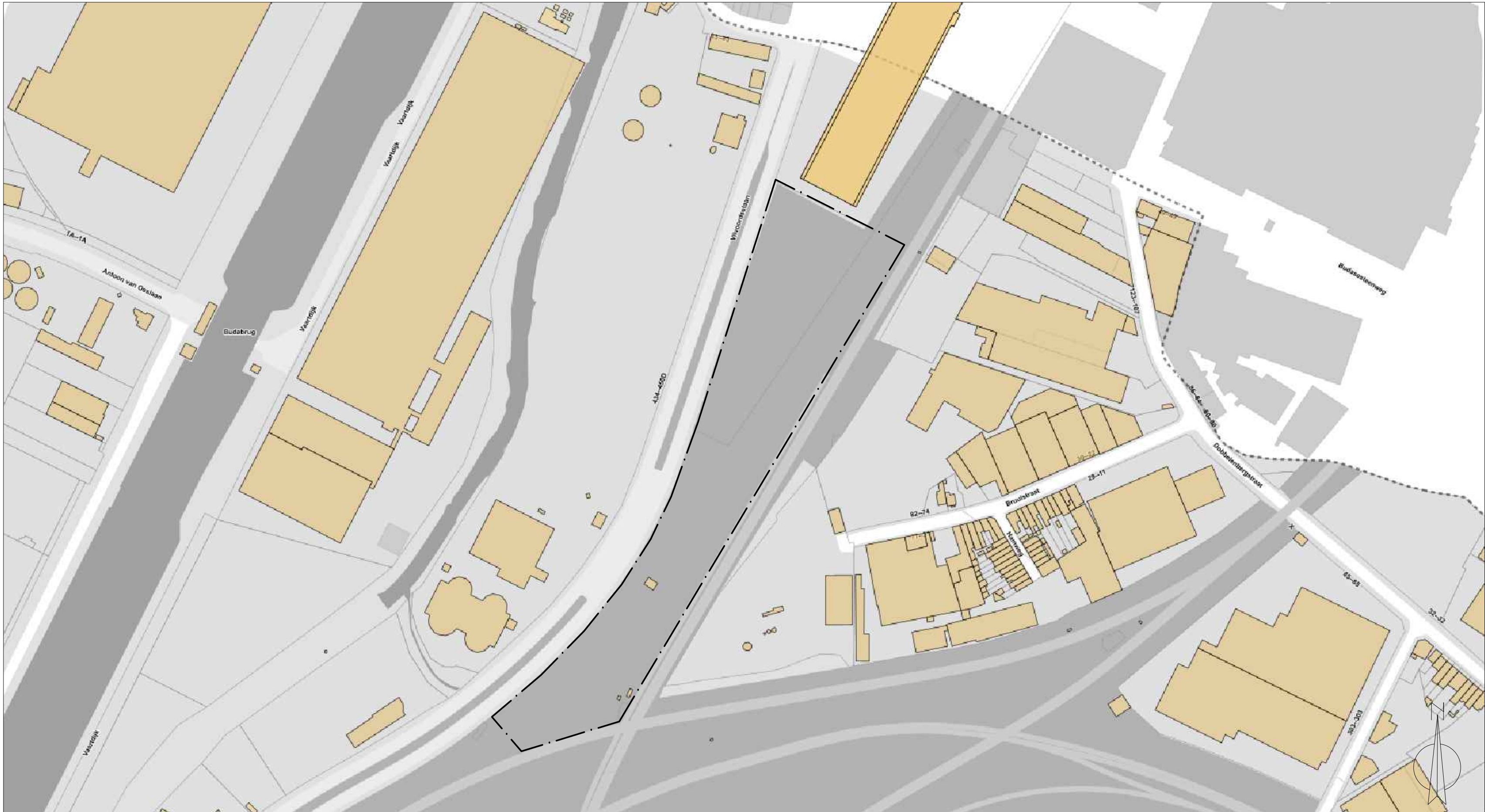
LIGGINGSPLAN 1:2500